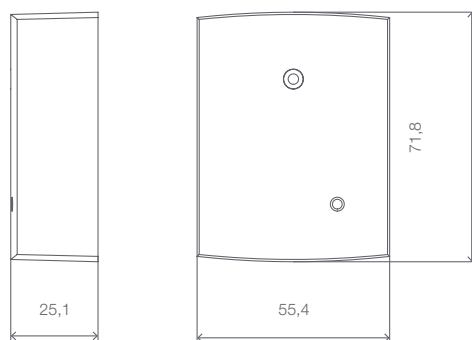
Maßangaben in mm